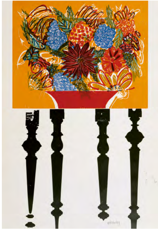
Grosser Herbststraus , aus der Folge: Herbst der Wilhelmstrassenkrämer, 1970 Holzschnitt auf Bütten, 77 × 55 cm Sammlung Würth, Inv. 312

Kunst. Er revolutioniert den Holzschnitt mit seiner Technik und überführt ihn ins Grossformat – mit einer eigenen, unverwechselbaren Bildsprache, die sich zwischen dichten, figürlichen und abstrahierenden Darstellungen bewegt. Dabei gelingt es ihm, dem harten, kantigen Material des Holzstocks auch zarte Töne zu entlocken.