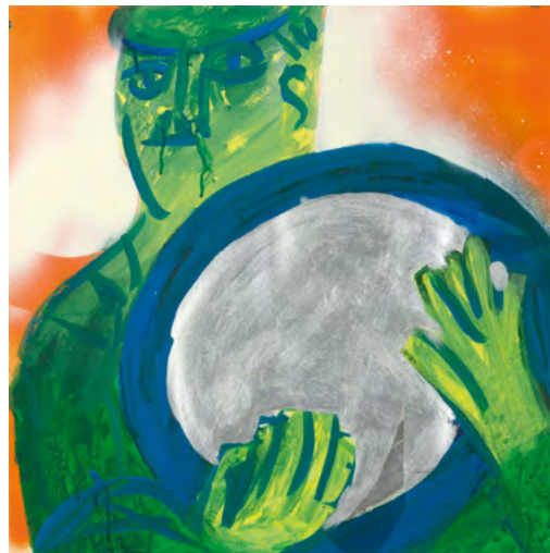
Selbstbildnis im Spiegel , vorbereitende Skizze zu «Eulenspiegel», 1970 Ölkreide, Lack, Gouache, Collage auf Papier, 50 × 50 cm Sammlung Würth, Inv. 12626

Leidenschaftlich und eigenwillig: HAP Grieshaber (1909–1981) gehört zu den bemerkenswertesten Künstlern der deutschen Nachkriegszeit. Das Ungefähre war nicht seine Sache. Weder ästhetisch noch politisch. «Ich will die grossen Themen der Menschheit angegangen haben», so der Künstler. Geprägt von gesellschaftlichen Umbrüchen, erschuf er Holzschnitte, die den Nerv der Zeit treffen. Grieshaber bekennt in diesem Medium im wahrsten Sinne Farbe: Schwarz oder Weiss, Sein oder Nichtsein, Materie oder Leere. Der gelernte Buchdrucker und Grafiker knüpft zunächst an expressionistische Traditionen des Holzschnitts an, geht aber auch weiter zurück bis zu dessen Ursprung in der altdeutschen