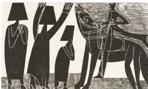
Ankunft bei den Nonnen, aus der Mappe: «Osterritt», 1964 Holzschnitt auf Hahnen- mühle-Bütten, 35 x 58 cm Sammlung Würth, Inv. 9583

Passionate and unconventional: HAP Grieshaber (1909–1981) stands among the most remarkable artists of the German post-war period. Approximation was not his way – neither aesthetically nor politically. “I want to have addressed the major topics of humanity,” the artist declared. Shaped by social upheaval, his woodcuts strike at the heart of the time. In this medium, Grieshaber takes a stand: black or white, existence or non-existence, matter or emptiness. Trained as a typographer and graphic artist, he initially drew on expressionist woodcut traditions, also reaching back to its origins in Old German art. He revolutionised the woodcut with his technique and expanded it into large-scale formats, developing an unmistakable pictorial idiom that moves between dense, figurative forms and abstract representations. Remarkably, he drew gentle and almost lyrical nuances from the rigid and angular woodblock.