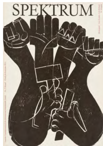
Spektrum Nr. 72 Internationale Vierteljahresschrift für Dichtung und Originalgrafik «Kampf», Zürich, 18. Jg. (Sept. 1976) Titelblatt von HAP Grieshaber: «Für Jerg Rätgeb» Holzschnitt, 44 × 31 cm Sammlung Würth, Inv. 9576