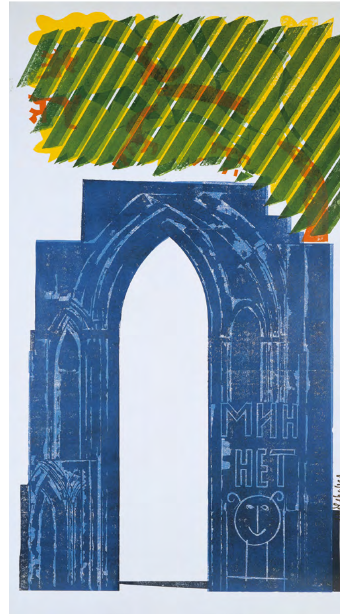
Hommage à Caspar David Friedrich , 1974 Holzschnitt auf Kupferdruckkarton, 214,5 × 120 cm Sammlung Würth, Inv. 16

HAP (Helmut Andreas Paul) Grieshaber wurde 1909 in Rot a. d. Rot (Oberschwaben) geboren. Er lernte zunächst Schriftsetzer und Buchdrucker. Aufgrund der Weltwirtschaftskrise musste er später sein Studium an der Staatlichen Kunstgewerbeschule Stuttgart abbrechen. 1933 erhielt Grieshaber von der Reichskulturkammer Berufsverbot und wurde 1940 zum Kriegsdienst einberufen. Nach 1945 machte er sich mit grossformatigen Holzschnitten einen Namen. Er nahm an der documenta 1955, 1959 und 1964 teil und prägte von 1955 bis 1960 als Professor an der Staatlichen Akademie der Bildenden Künste Karlsruhe Künstler wie Horst Antes und Walter Stöhrer. Grieshaber starb 1981 in Eningen unter Achalm bei Reutlingen.