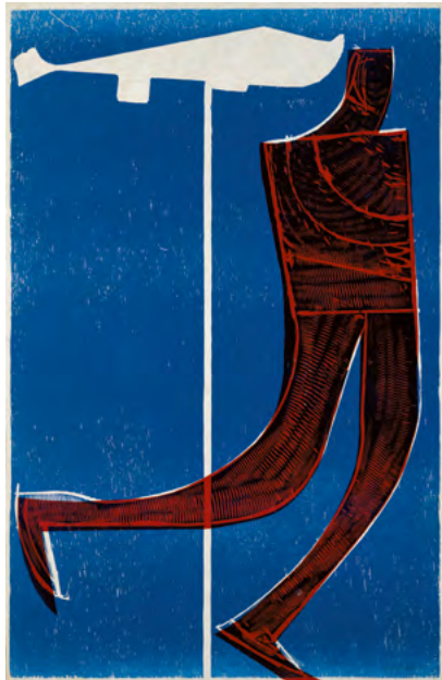
Olympia I, 1969 Holzschnitt auf Werkdruckpapier, 100 x 66 cm Sammlung Würth, Inv. 4156

With “Incision | Expression”, Forum Würth Arlesheim presents the first solo exhibition in Switzerland dedicated to HAP Grieshaber from the Würth Collection. On view are selected works (woodcuts, paintings, publications, posters and photographs) from the 1960s to the 1980s, including significant series such as “Totentanz von Basel” (Basel's Dance of Death) and “Osterritt” (Ride at Easter). The exhibition highlights his socio-political works, his musically and lyrically inspired pieces, as well as some of the artist's pictorial letters and a series of self-portraits. It reveals how the “incision” in Grieshaber's art is both a formative gesture and an attitude – a pointed expression that moves between protest, poetry and spiritual depth.