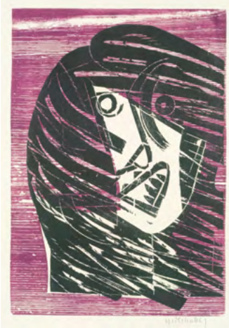
Sturmflut , aus der Folge: Pablo Neruda: Aufenthalt auf Erden, 1972 Holzschnitt auf Werkdruckpapier, 30 × 21 cm Sammlung Würth, Inv. 2109

Die Ausstellung wird um einen separaten interaktiven Raum, das «HAP Lab», sowie um das gemeinsam mit der Basler Papiermühle realisierte Suchspiel «Zeitreise mit Karlchen» erweitert, die jeweils eine individuelle Auseinandersetzung mit dem Künstler und seinem Schaffen ermöglichen.